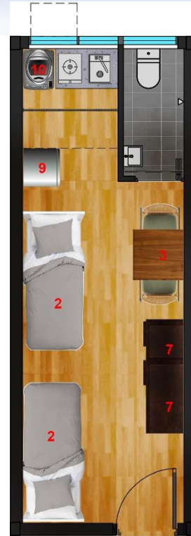
3-4 人單位(約 190 平方呎)