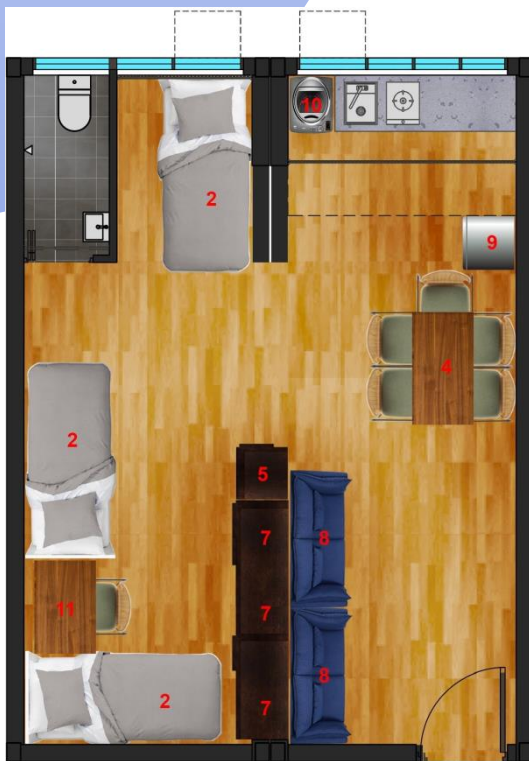
5 人單位(約 406 平方呎)