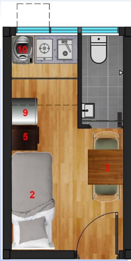
1-2 人單位(約 124 平方呎)