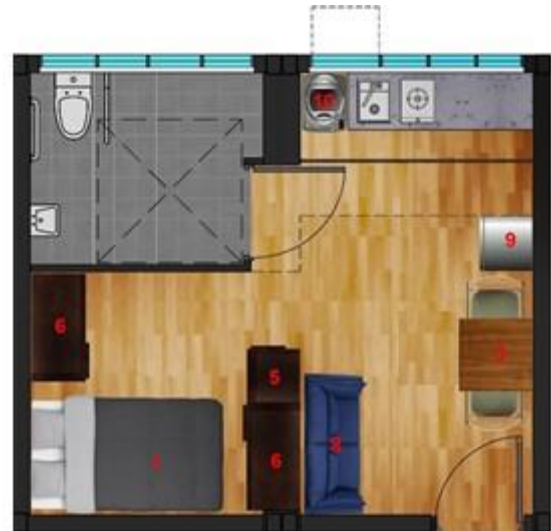
無障礙單位(約 262 平方呎)